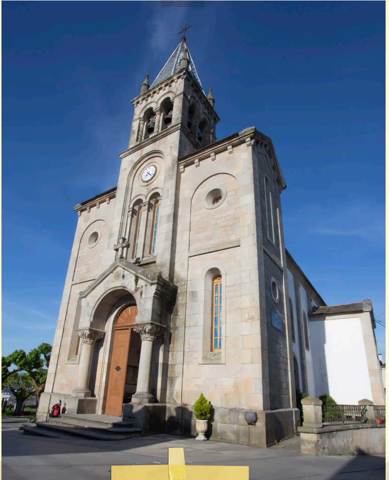
Igrexa de Santa Mariña