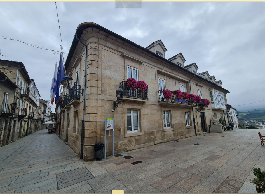
Casa do Concello