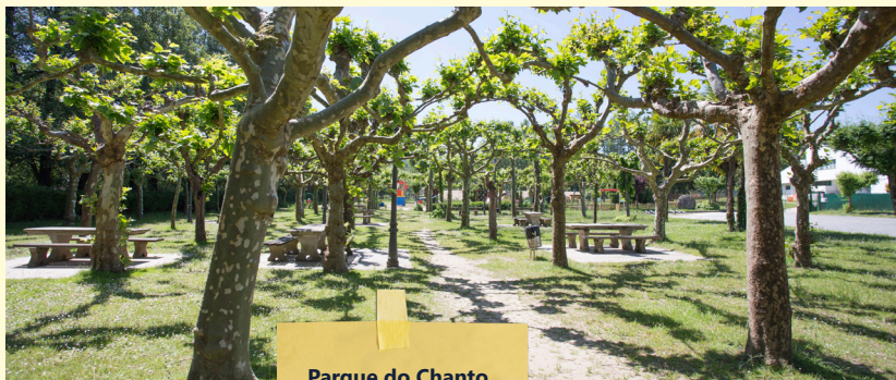
Parque do Chanto

Merecen ser conocidos: PASEO DO MALECÓN DO RÍO SÁRRIA, PARQUE DE O CHANTO, PARQUE DO BOSQUE, XARDÍNS DE SAN VICENZO DE PAUL (O Mazadoiro), PARQUE CASTRO AGRASAR, PASEO DAS AMENEIRIZAS, INSUA DA VEIGUIÑA, RUTA DA "FOZ DAS ACEAS" Y PASEO DO RIO CELEIRO.