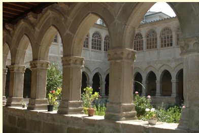
Claustro Mosteiro da Madalena

Un magnífico escudo agustiniano , bordeado por la leyenda “Sicut aquila incitans ad volandum pullos suos”, y varios escudos de las familias nobles que señorearon la comarca embellecen el conjunto. Además del Convento e Iglesia de la Merced el edificio principal y anexos acogen un centro de enseñanza y un albergue , heredero de la primitiva fundación.