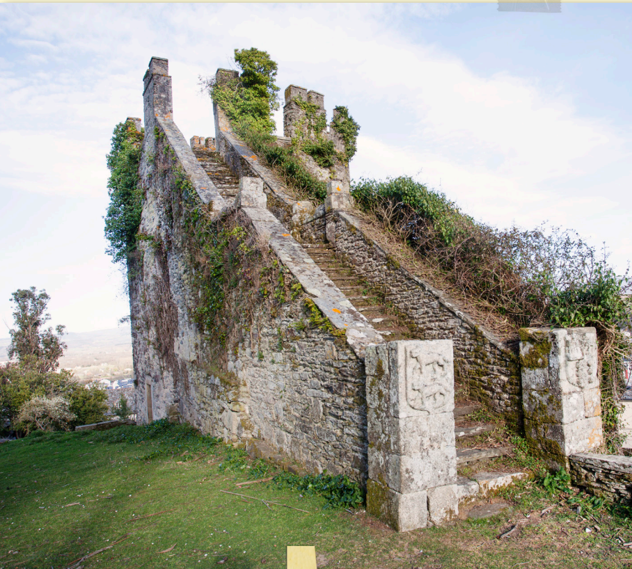
Torre de la Fortaleza