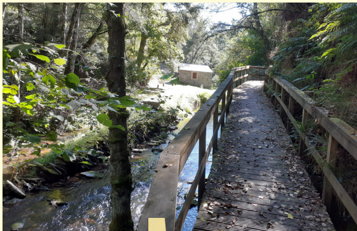
Ruta da Foz das Aceas