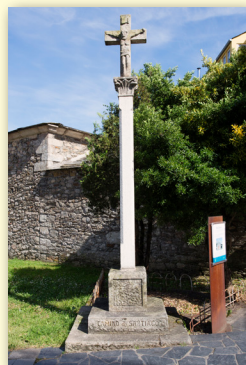
Cruceiro Capela de San Lázaro

Único resto del antiguo hospital de San Lázaro, que estuvo destinado a la atención de leprosos hasta el año 1700. A su lado hay un cruceiro de Manuel Mallo. Es una pequeña capilla con porche ( s. XVIII ), inmediata a la Rúa do Porvir ("Rúa dos Anticuarios"). En esa calle se pueden visitar varias tiendas de anticuarios, con una variada y rica oferta.