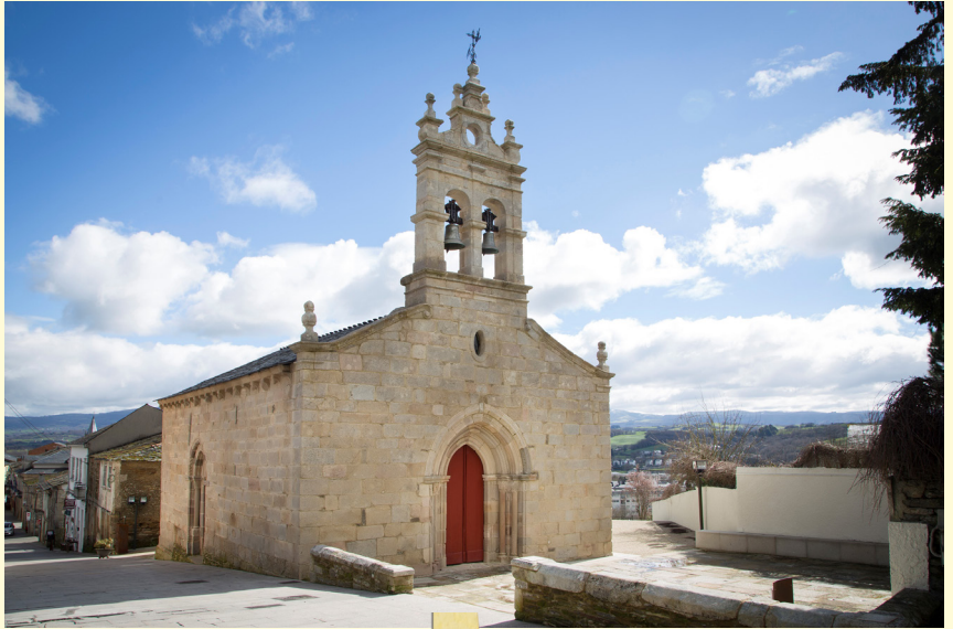
Igrexa de San Salvador